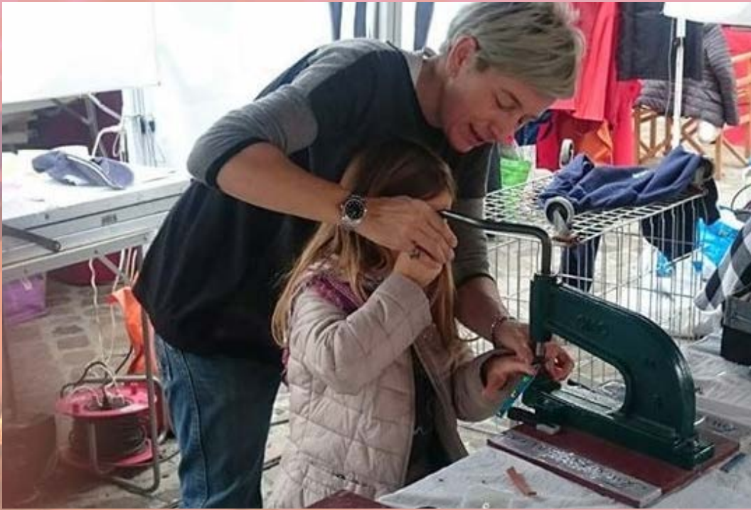
IMMAGINI DALLE PASSATE EDIZIONI DELLA FIERA DI SAN CRISPINO