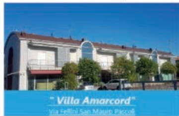
"Villa Amarcord" Via Fellini San Mauro Pascoli