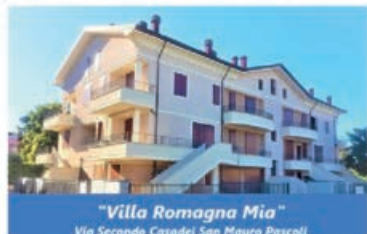
"Villa Romagna Mia" Via Secondo Casadei San Mauro Pascoli

L'Immobiliare Tosi, in linea con la sua tradizione di "OFFRIRE LA SCELTA MIGLIORE", in zona molto servita con gradevoli fabbricati di basso impatto, è veramente lieta di presentare le Palazzine "Villa Romagna Mia" - Via Secondo Casadei, e "Villa Amarcord" - Via Fellini, di pregevole fattura architettonica, IN PRONTA CONSEGNA , composte da appartamenti anche con ingresso indipendente e giardino privato, con molteplici soluzioni; le rifiniture interne sono di ultima generazione. Prenotate una visita con i nostri competenti collaboratori dove risconterete cortesia, qualità e convenienza. Venite a trovare anche tante altre soluzioni! Vi aspettiamo!