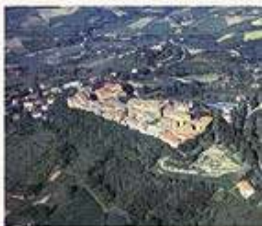
Vista aerea del borgo di Saludecio