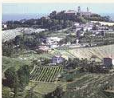
Vista panoramica del borgo di Saludecio

Pronto Soccorso 118 Ospedale "Cervesi" Cattolica Tel. 0541.986111 Guardia Medica Morciano di R. Tel. 0541.854403 Farmacia Comunale Beato Amato Ronconi Tel. 0541.981666 Carabinieri Tel. 0541.981612 Polizia Municipale Unione Valconca Tel. 0541.857790 Uffici Comunali Tel. 0541.869701 Biblioteca c/o Comune Ufficio Turistico Tel. 0541.981345 Pro Loco Tel. 0541.850003 Museo del Beato Amato Ronconi Tel. 0541.982100 Ufficio Postale Tel. 0541.850062